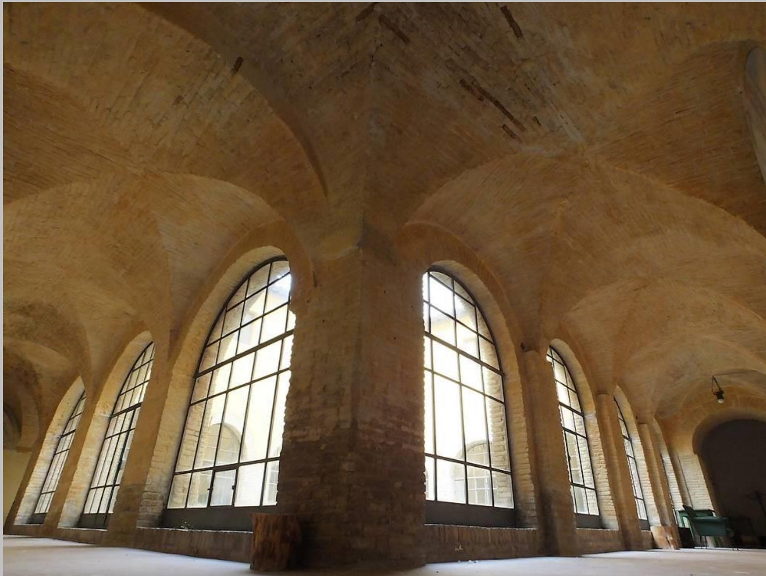
Chiostrò del monastero della Chiesa di Santa Maria della Pace, Sassoferrato (AN).