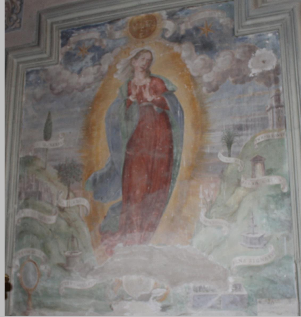
Tarquinio Salvi, Eduazione di Gesù e Immacolata , 1613, Cappella Piersanti, chiesa di Santa Maria di Ponte del Piano, Sassoferrato.