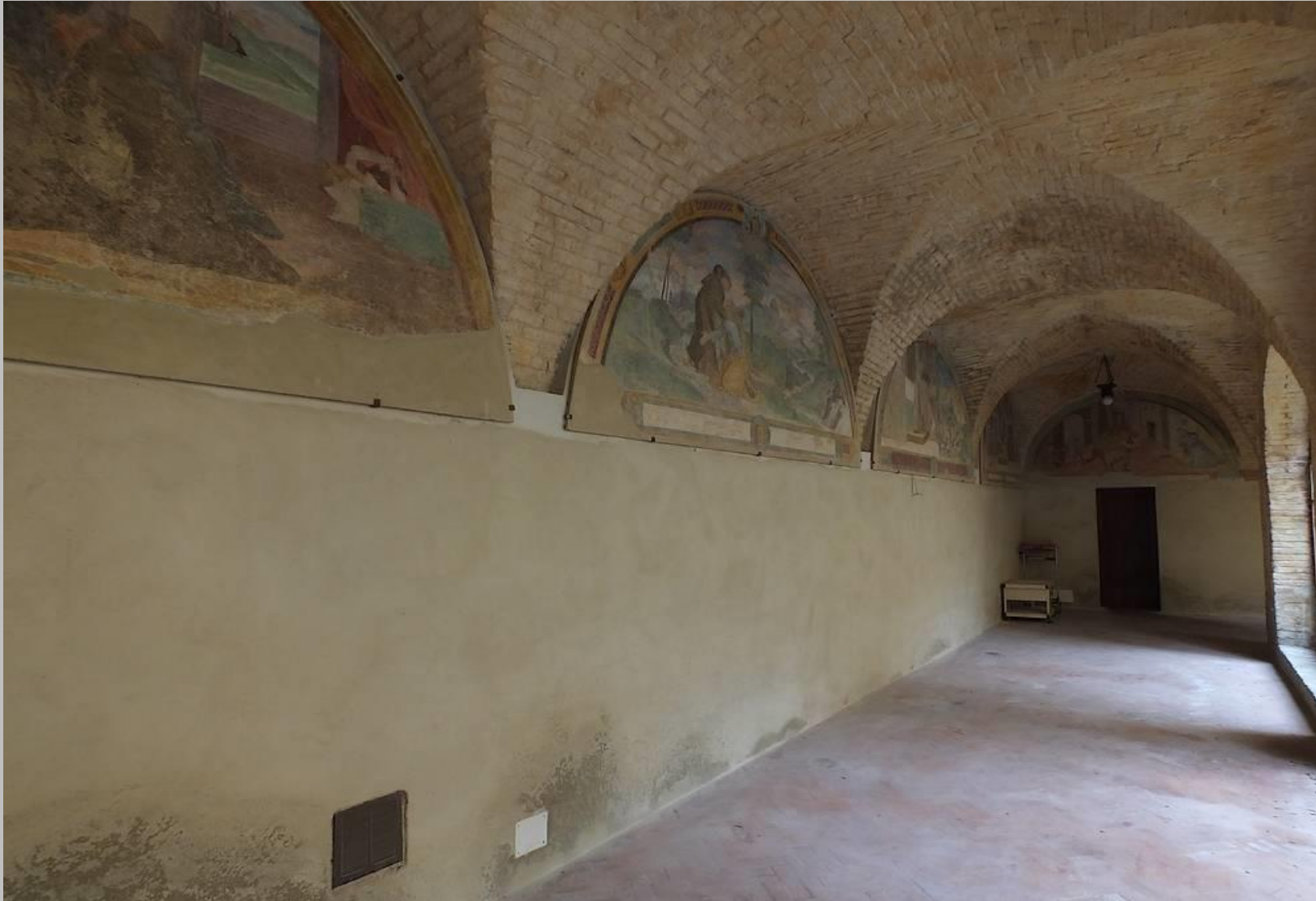
Chiostrò del monastero della Chiesa di Santa Maria della Pace, Sassoferrato (AN).