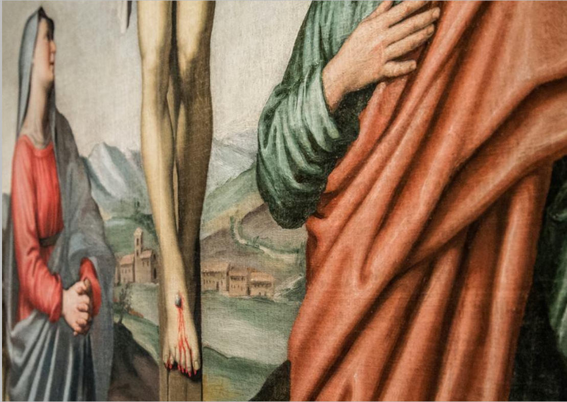
Giovan Battista Salvi, Crocifissione , Pinacoteca Civica (1991), da Chiesetta della frazione Castagna, Sassoferrato.