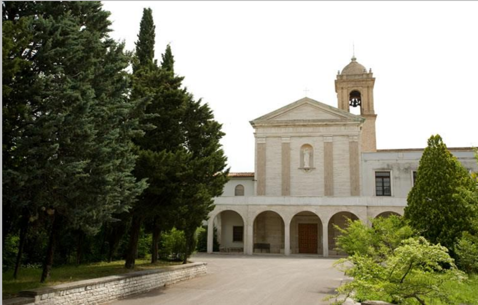
Chiesa di Santa Maria della Pace, Sassoferrato (AN).